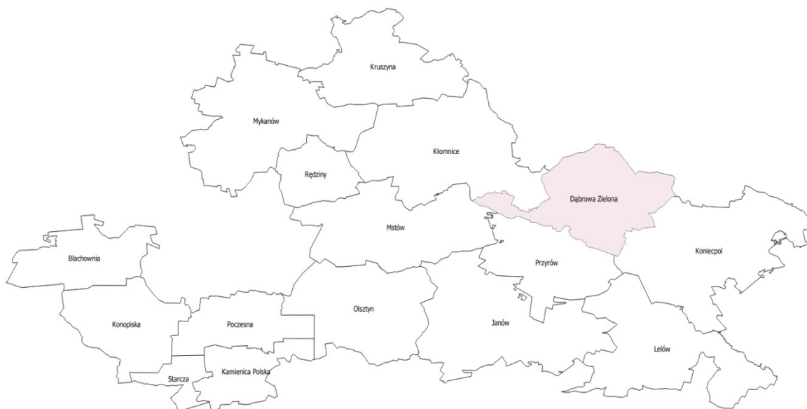
Rysunek 2. Gmina Dąbrowa Zielona na tle powiatu częstochowskiego.