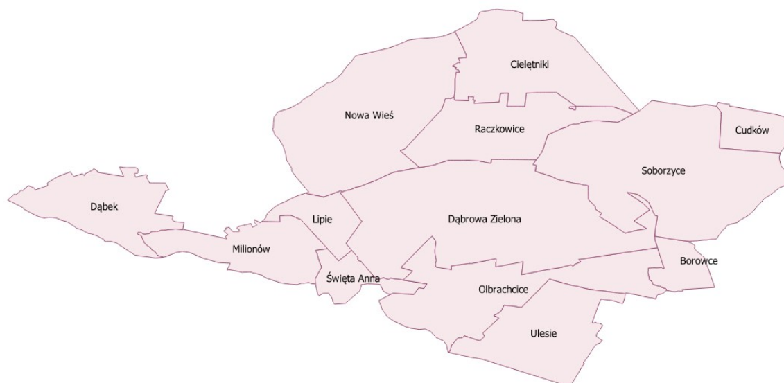
Rysunek 1. Położenie poszczególnych miejscowości na tle Gminy Dąbrowa Zielona.

Gmina Dąbrowa Zielona to gmina wiejska zlokalizowana w powiecie częstochowskim, w północno – wschodniej części województwa śląskiego. W skład gminy wchodzi 14 sołectw. Są to: Borowce, Dąbek, Cielętniki, Cudków, Dąbrowa Zielona, Nowa Wieś, Olbrachcice, Raczkowice, Raczkowice-Kolonia, Lipie, Soborzyce, Święta Anna, Ulesie, Zaleszczyzny.