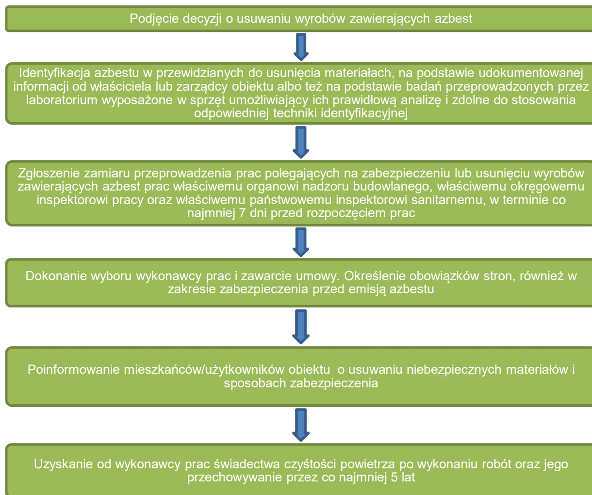
Rysunek 4. Schemat procedury dotyczącej obowiązków i postępowania właścicieli i zarządców przy usuwaniu wyrobów zawierających azbest z obiektów i terenów zlokalizowanych na terenie Gminy Dąbrowa Zielona.