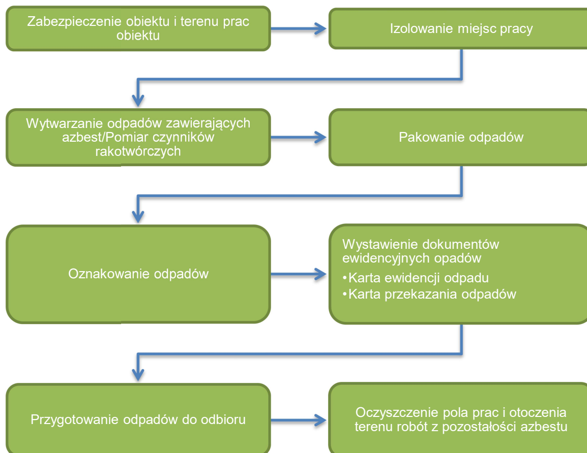
Rysunek 6. Schemat procedury dotyczącej prac polegających na usuwaniu wyrobów zawierających azbest, wytwarzania odpadów niebezpiecznych wraz z oczyszczaniem obiektu/terenu/instalacji.

Po zakończeniu prac demontażowych teren robót oraz jego otoczenie należy doprowadzić do porządku. Wykonywane prace porządkowe należy wykonywać stosując metody uniemożliwiające emisję pyłu azbestowego do środowiska. Wykonawca prac jest także zobowiązany do przedstawienia zleceniodawcy pisemnego oświadczenia stwierdzającego prawidłowość wykonanych prac. W przypadku prac dotyczących azbestu miękkiego lub wyrobów zniszczonych i uszkodzonych, w pomieszczeniach oraz w przypadku prac obejmujących usuwanie krokidolitu wykonawca ma obowiązek przedstawienia wyników badań powietrza przeprowadzonych przez uprawnione do tego laboratorium lub instytucję.