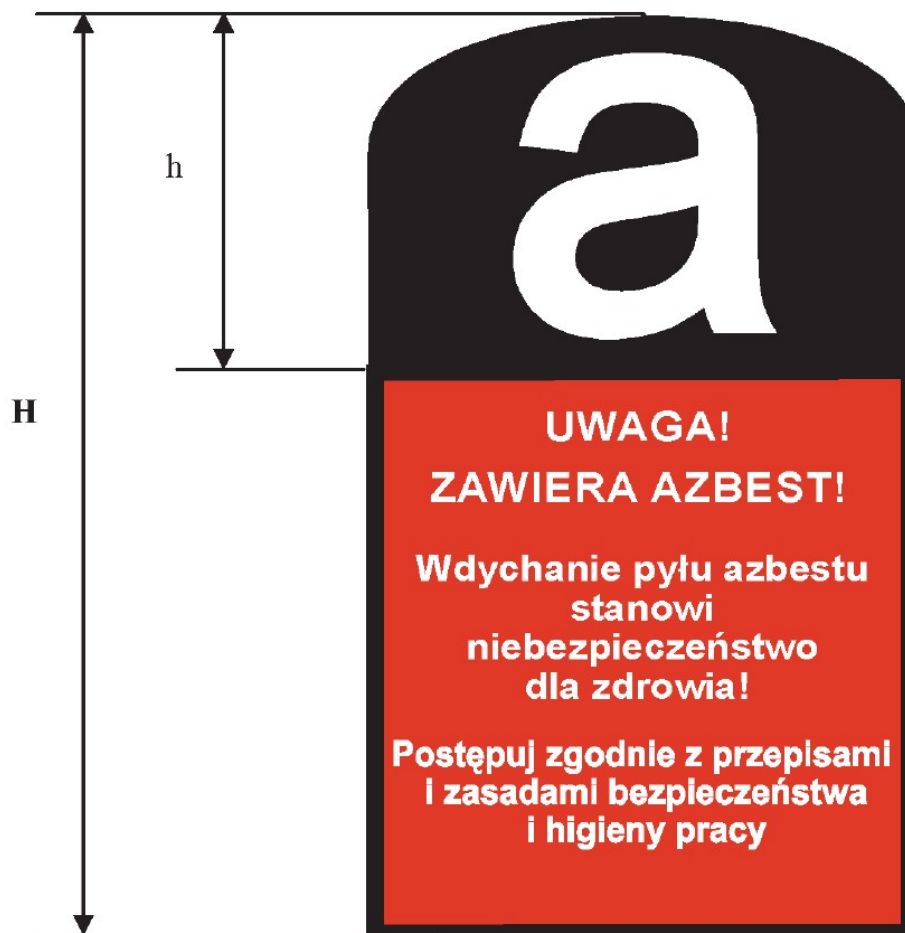
Rysunek 5. Wzór oznakowania wyrobów, odpadów i opakowań zawierających azbest lub wyroby zawierające azbest, a także miejsca ich występowania.